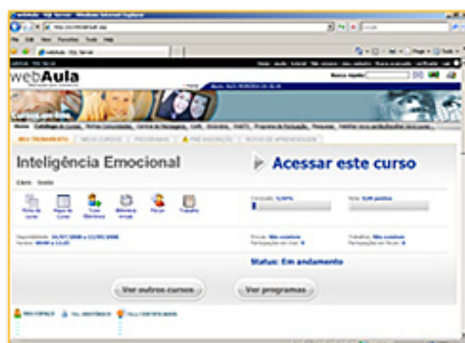
Tela principal do ambiente aluno